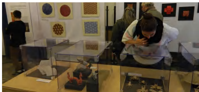
A kiállítás február 13-ig tekinthető meg

Szemet gyönyörködtető origami kiállítás érkezett a városba a Voke Batsányi János Művelődési és Oktatási Központba, amelynek apropóját a tavaly 25 éves Magyar Origami Kör jubileuma adta. A vándorkiállítás február 13-ig tekinthető meg.