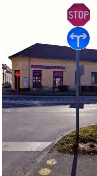
A két irányba történő kihajtást többen balesetveszélyesnek tartják

dolga az is nehezíti, hogy szinte teljesen ki kell engedni az autó első felét az útra, hogy láthatóvá váljék a Hősök tere és a Keszthelyi út felől érkező forgalom. (di)